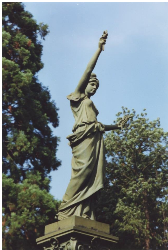
© Maryse Durin et Françoise Fernandez, 1992.