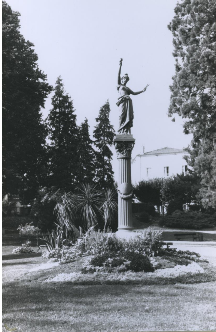
© Maryse Durin et Françoise Fernandez, 1992.